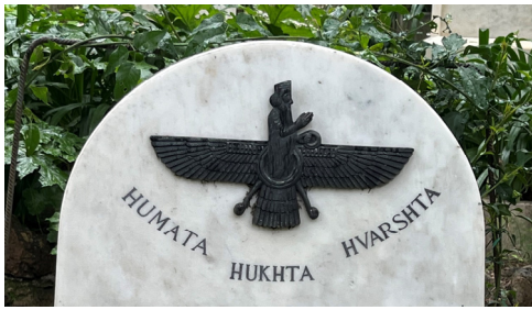
Il farāvahār, simbolo dello zoroastrismo