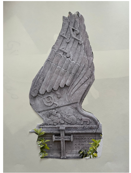
Il memoriale di Stamoulis