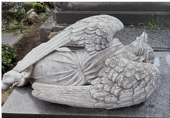
L'angelo nella Zona 1.15.43

Credo che l'"uccello immortale" di Keats evocasse l'idea che un canto, come una voce, come un'ode, come un'anima, potesse spiccare il volo attraverso le generazioni, attraverso il tempo. È tra quelle generazioni che seppellirono i propri morti qui a Roma, sorprende quanti scelsero