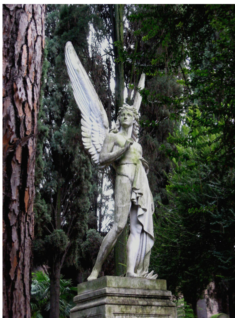
L'Angelo della Resurrezione di Franklin Simmons

Come in Egitto, anche in Italia edifici, monumenti e lapidi venivano costruiti o scolpiti per durare nel tempo. A Roma, il materiale prediletto per un monumento funebre è da lungo tempo il marmo bianco di Carrara. Nella vicina Pietrasanta, generazioni di abili artigiani hanno lavorato per tradurre le idee degli artisti in opere