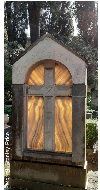
La lapide di Frank Timings