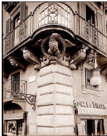
La pasticceria Ronzi e Singer