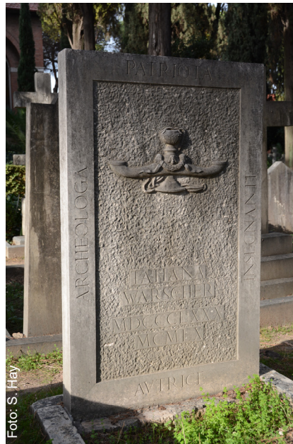
La lapide della tomba