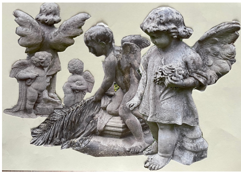
Le ali dei cherubini

ta e geometricamente rigorosa rappresentazione di ali commemora un seguace dello Zoroastrismo. La stilizzata effigie alata di un avvoltoio – che richiama, a mio avviso, i bassorilievi egiziani – qui è fusa in bronzo (Zona 2.15.28).