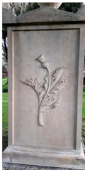
Il monumento alla Garden, cardo con la firma di Gott in basso a destra