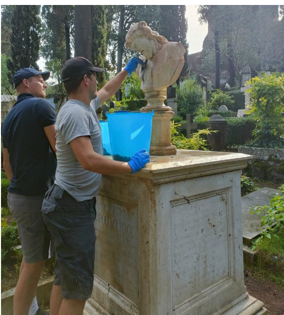
Pulitura del busto di Clésinger

(1843-1874; Zona 1.9.51), e Hermann (1844-1895; Zona 2.12.4). Entrambe le tombe presentano un esempio della scultura Testa di Cristo di Jean-Baptiste Auguste Clésinger (1814-1883), molto diffusa e riprodotta; le sculture erano una volta protette da un baldacchino, sormontato da una croce, ma questa copertura, sulla tomba di Arnold, fu danneggiata nel 1979 dalla caduta di un albero (oggi è conservata nel Lapidario della Zona Terza), lasciando così il busto più esposto alle intemperie. L'intervento si è svolto secondo le consuete procedure: applicazione di un biocida, trattamento con un impacco chimico per rimuovere la patina nera e, successivamente, un'altra applicazione di biocida.