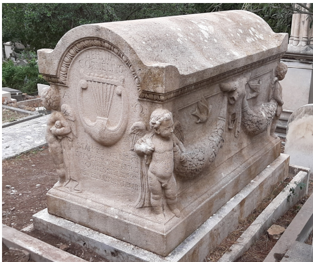
Il sarcofago di Cornelius dopo la pulitura

Il monumento ad Arnold Corrodi è una delle cinque tombe di questa famiglia di artisti di origine svizzera presenti nel Cimitero. La sepoltura del celebre pittore Salomon Corrodi (1810-1892) è formata da un basamento su cui si erge una splendida croce decorata a mosaico (Zona 1.14.57). Poco più in basso, giacciono i suoi due figli artisti: Arnold, morto giovane