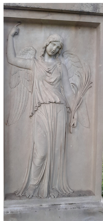
Il monumento alla Garden, angelo