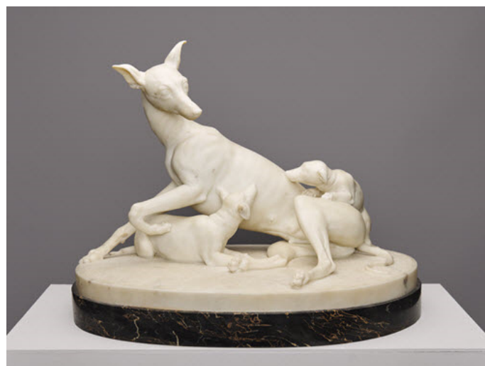
J. Gott, Levriero con cuccioli , Barber Institute of Fine Arts

Joseph Gott fu uno degli scultori neoclassici inglesi più noti e prolifici tra quelli che erano a Roma. Vi arrivò nel 1822 con la sua giovane famiglia, portando con sé una lettera di presentazione di Sir Thomas Lawrence indirizzata ad Antonio Canova in cui veniva descritto come