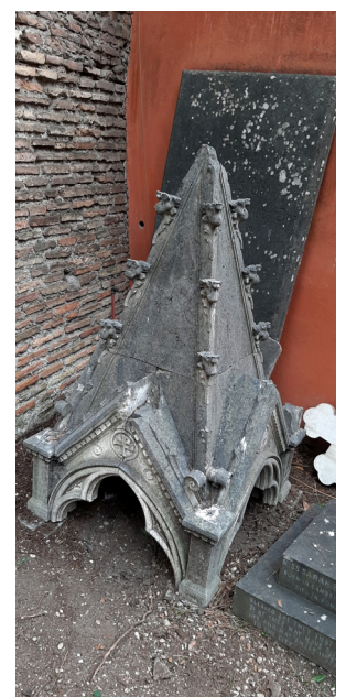
Baldacchino danneggiato nel Lapidario