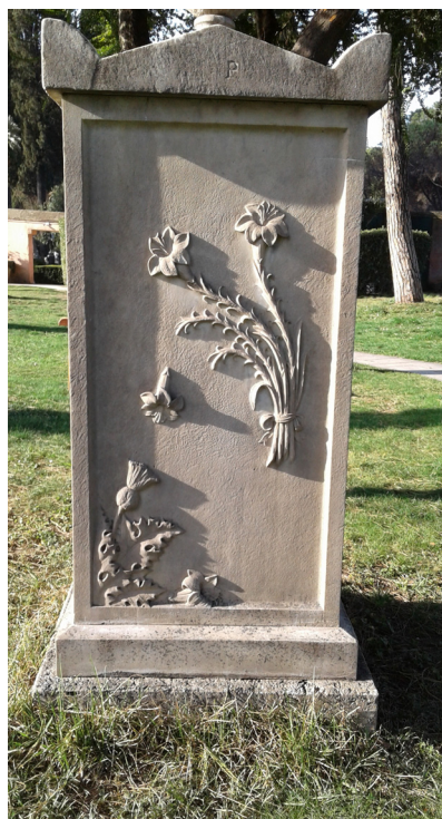
Il monumento alla Garden, giglio e cardo

un giglio: un fiore è adagiato a terra, un altro sta cadendo, simbolo di una vita presto interrotta. Sul lato nord, un angelo alza il braccio destro verso il cielo, gesto che tradizionalmente invoca l'autorità di Dio; nella mano sinistra invece stringe una foglia di palma, raffigurante la resurrezione. Alla base del lato ovest compare l'iscrizione: J. GOTT. F. †