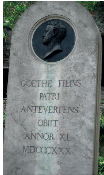
Tomba di August von Goethe, figlio del grande poeta