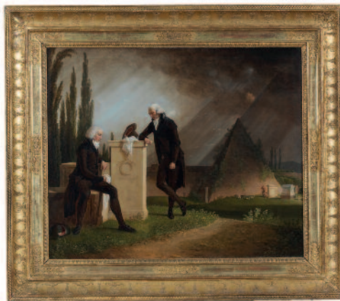
Jacques Sablet (Morges 1749 - Paris 1803), Roman elegy, 1791, olio su tela, cm 62x74

Al momento dello scavo perlustrativo della tomba (la cui prima illegittima violazione risale al medioevo) né urne cinerarie né il sarcofago sono stati rivenuti dagli archeologi, quindi ancora adesso non si è potuto stabilire se Caio Cestio venne cremato o inumato. All'appello mancavano anche i tipici oggetti preziosi che in genere fanno da corredo ai morti benestanti. Ma ciò era prevedibile: per legge, Augusto aveva appena vietato l'ostentazione del lusso nelle tombe. ■