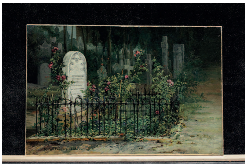
John Linton Chapman (Washington, D.C. 1839 - Baychester, New York 1905), La Tomba di Sophia Howard, 1862, olio su carta applicata su tavola, cm 17x25,5

(Brest, Musée des Beaux-Arts) Non si conosce l'identità delle due figure che Sablet riprende in primo piano in questo dipinto dell'antico cimitero acattolico ai piedi della Piramide, ma i tre maggiori monumenti funebri che rappresenta in secondo piano sono ancora oggi riconoscibili. A sinistra, la tomba di Reitzenstein e quella di Werpup, in parte coperta dalla prima; a destra, il sarcofago del russo Guilelmus Grote.