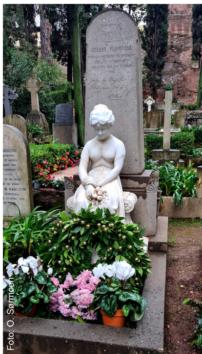
Il monumento restaurato