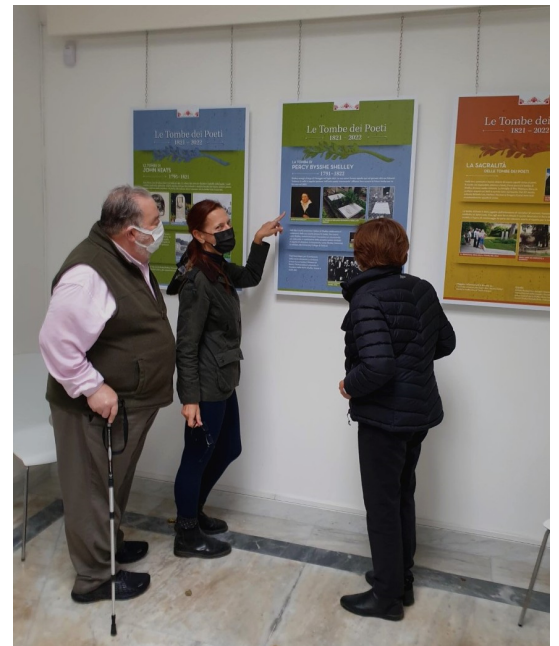
Poster di Keats e Shelley