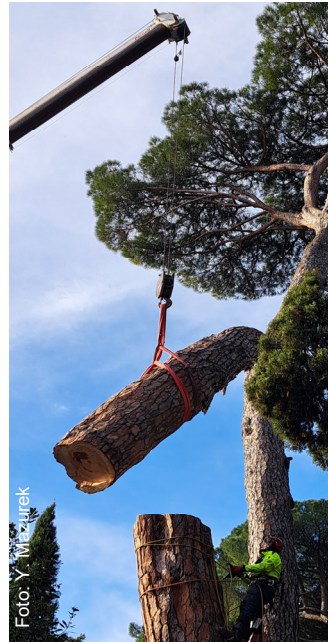
Rimozione dell'apice del tronco