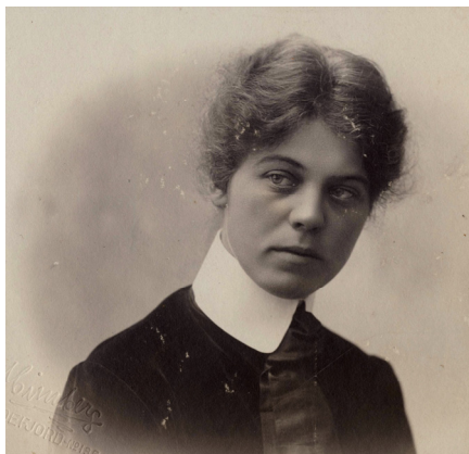
Helene Klaveness

Per la prima volta in quasi trent'anni, possiamo ammirare di nuovo la bellissima scultura della norvegese Helene Klaveness (1878-1908) così come fu ideata. La notte del 25 aprile 1995 alcuni ladri rubarono la testa dalla figura seduta progettata dal noto scultore danese Louis Hasselriis (Zona 3.1.2.7). Immediatamente denunciato alla polizia, il furto è tuttora irrisolto (nella stessa notte furono rubate altre sculture, purtroppo mai recuperate).