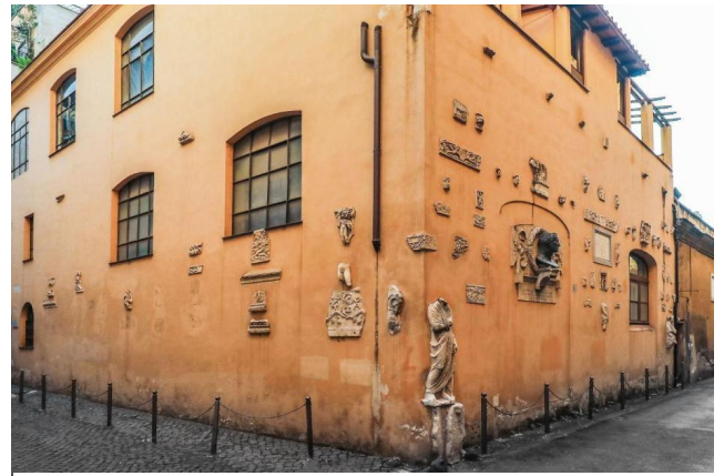
Lo studio di Canova.