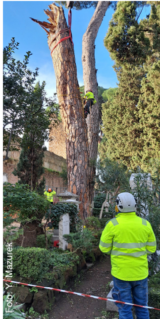
Preparativi per rimuovere l'apice del tronco

All'inizio di febbraio, la società di manutenzione degli alberi Alberando ha rimosso il ceppo di pino spezzato a metà dal vento ( Newsletter 60). Poiché l'accesso veicolare all'interno del Cimitero è impossibile, è stato necessario un permesso dal Comune per installare una gru sul suolo pubblico al di là delle mura aureliane. Il tronco è stato rimosso in due sezioni. L'analisi degli anelli del ceppo ha restituito un'età di circa 160 anni. In base alla posizione, questo pino e il suo vicino – un albero della stessa età, potato ora da Alberando – sarebbero stati piantati quando fu progettata la prima estensione del Cimitero alla fine degli anni 1850. Il lieve danno ad un tratto restaurato della cinta muraria sarà riparato dalla Soprintendenza del Comune di Roma.