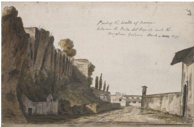
Thomas Jones, Veduta delle mura con il Muro Torto , 1777 (British Museum)

All'inizio di marzo Jones fece un'escursione a nord di Roma, verso Ponte Milvio. Quel giorno realizzò il suo primo schizzo appena fuori le mura del Muro Torto, un'area nota da tempo perché vi si seppellivano gli eretici. È una delle pochissime vedute conosciute di questo luogo, e raffigura un recinto di pietra sormontato da un'edicola. Grazie alla curiosità dell'artista nell'esplorare zone poco visitate, e al British Museum che ha pubblicato online il contenuto dei suoi quaderni con gli schizzi, oggi sappiamo qualcosa in più sui cimiteri alla fine del XVIII secolo.