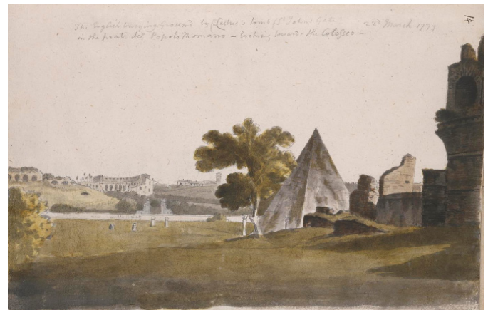
Thomas Jones, Veduta del Cimitero inglese , 1777 (British Museum)

Thomas Jones, arrivato a Roma alla fine del 1776, amò da subito fare escursioni nelle aree meno battute dai suoi numerosi colleghi artisti in città. Una di queste lo portò nella zona dominata dal Monte Testaccio, la collina alta 36 metri composta principalmente da frammenti di anfore olearie romane. Conosciuta come Prati del Popolo Romano, era una terra comune, tradizionalmente adibita al pascolo. Nei suoi quaderni (ora al British Museum e al National Museum of Wales), Jones eseguì degli schizzi annotandone la data e talvolta anche l'ora del giorno. Tale precisione ci permette di ricostruire la sua escursione al Testaccio al 22 marzo 1777. Jones illustrò particolarità raramente registrate da altri artisti, come la dogana (La Doganella), che controllava l'accesso ai Prati e anche al "cimitero inglese" ai piedi della Piramide. Nel suo acquerello del Cimitero raffigura quattro lapidi, esattamente il numero, a nostra conoscenza, di quelle erette prima del 22 marzo 1777 (di Werpup, Macdonald, Stevens e von Reitzenstein).