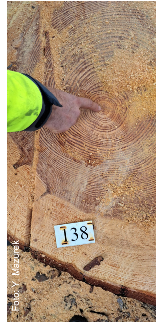
Il moncone esposto