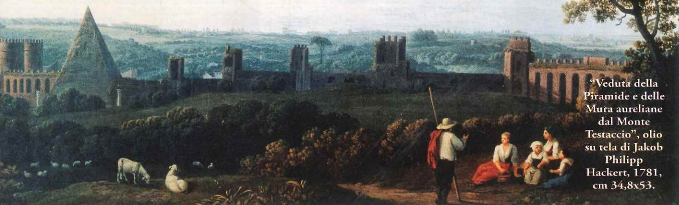
"Veduta della Piramide e delle Mura aureliane dal Monte Testaccio", olio su tela di Jakob Philipp Hackert, 1781, cm 34,8x53.

Per i 300 anni del Cimitero acattolico di Roma, alla Casa di Goethe sono esposte le opere degli artisti che lo hanno raffigurato.